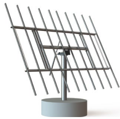
DEGERtracker D60H (1)