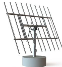
DEGERtracker D100 (1)