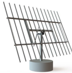
DEGERtracker D80 (1)