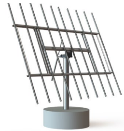
DEGERtracker D100 (1)